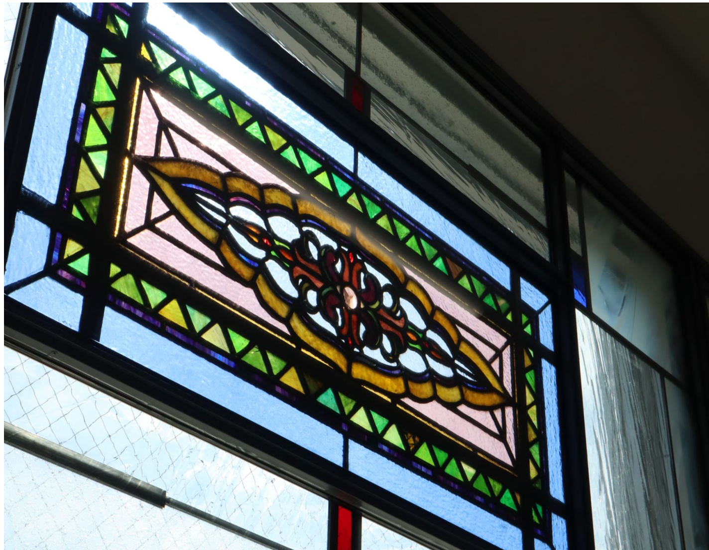
階段に光差し込むステンドグラス