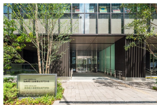
学校エントランス