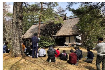
三五荘(古民家)スケッチ