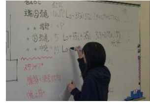
建築積算の数量算出 学生が計算を解く