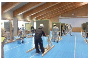
左官：壁モルタル塗り