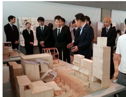
建築主に対する個別プレゼンテーション