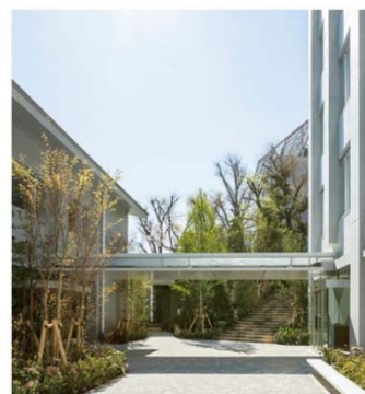
キャンパスプラザ