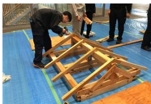
屋根小屋組み立て