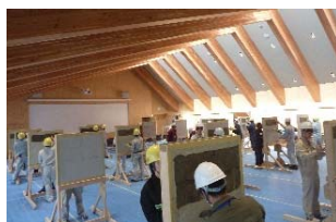
タイル：張り付けモルタル塗り