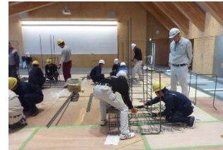
鉄筋組み立て実習全景