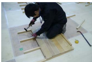
フローリング張り