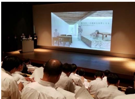
建築主に対する全体プレゼンテーション

金融機関様に近傍で建設計画のある建築主をご紹介いただき、法規制に照らし合わせて建設可能な提案をグループ課題として取り組む、実践的なプログラムです。学生自身が建築主への聞き取り調査や敷地調査を経て、計画・設計を行い、建築主と金融機関様の全支店長をお招きしてプレゼンテーションを行っています。